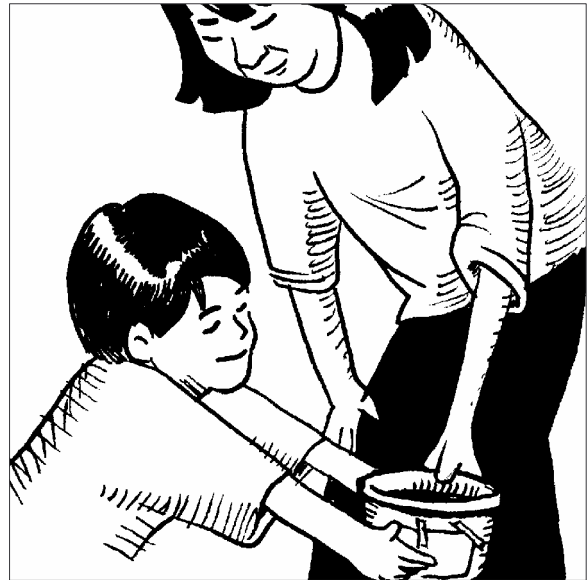
Ayude a decorar el recipiente para dinero con fotos de las cosas que su niño quiere comprar.

Usted ayudará a su niño a hacer un recipiente especial para dinero. Su niño puede usar el recipiente para mantener el dinero seguro hasta que sea hora de ir a la tienda. Deje claro que su niño puede decidir cómo gastar el dinero del recipiente.